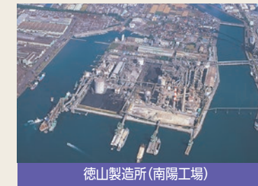
徳山製造所(南陽工場)