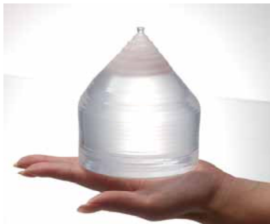
LiCaAlF 6 単結晶 φ100mm