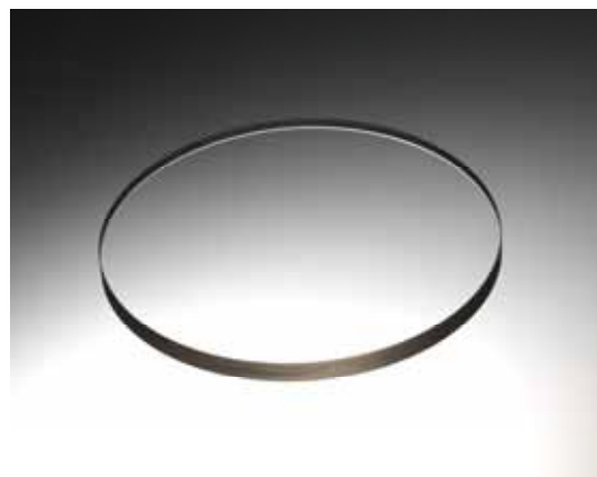
単結晶シンチレータ φ100mm × t10mm