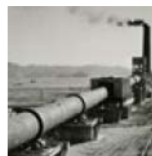
東洋一のセメント湿式法 「マンモスキルン」(長さ185m)